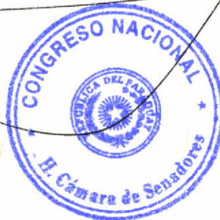
Silvio Ovelar B. Presidente H. Cámara de Senadores